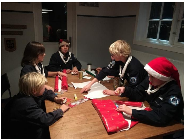
Der pakkes gaver ind, laves julestjerner på tid i julemandens værksted.

Vi har både haft juniorernes egen juleafslutning med mange små sjove juleopgaver. Ved gruppens juleafslutning havde troppen arrangeret et løb for juniorer og minier, mens der blev holdt møde med forældrene.