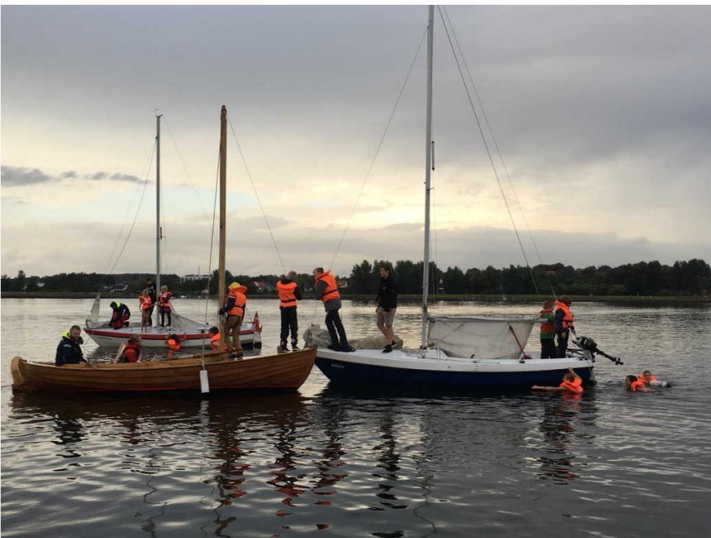
Svømning på åbent vand og på slæb efter bådene er altid spændende. Juniormøde i august 2016.

Sidst på sæsonen kan vi godt finde på at bade fra bådene, og det er meget spændende at svømme på åbent vand og blive trukket efter en båd. Så selvom det var koldt i år, var det næsten alle der sprang i.