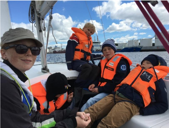
Juniorene sejler selv bådene, her på gruppeturen til Mou. Lederen er kun fotograf.

Sidst på sæsonen kan vi godt finde på at bade fra bådene, og det er meget spændende at svømme på åbent vand og blive trukket efter en båd. Så selvom det var koldt i år, var det næsten alle der sprang i.