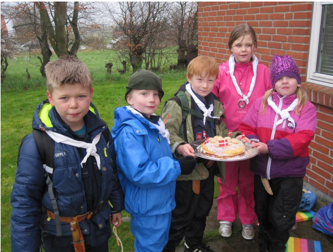
Minierne til dronnings fødselsdag

I løbet af året har minierne også deltaget på en del forskellige ture og arrangementer. I foråret var vi med resten af gruppen på Harry Potter tur til Flamsted. I foråret var minierne til Dronningens fødselsdag – hun havde vist ikke rigtigt været artig for det regnede vist hele dagen. Årets sommerlejr gik sammen med juniorerne til Jegindø ved Struer, hvor der var en masse oplevelser.