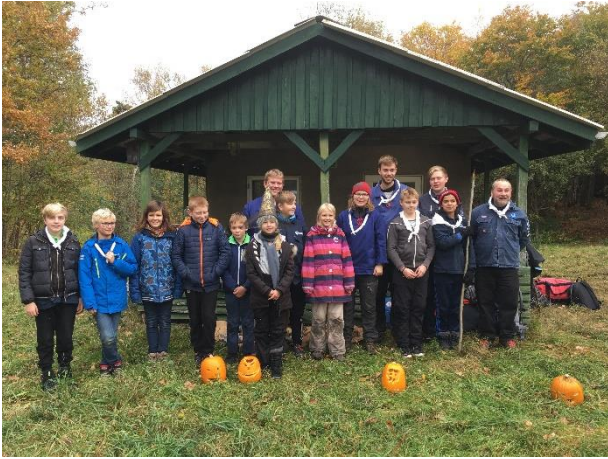
Deltagerne på Halloweenturen til Flamsted

Når sejlsæsonen er ovre genoptager vi svømningen en gang om måneden, og møder hvor vi kan lave lidt af alt muligt, f.eks. har vi i efteråret lavet toværksroset og lært om at gå efter kort.